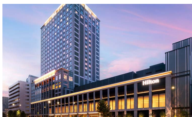
HIROSHIMA: HILTON PREMIUM TWIN