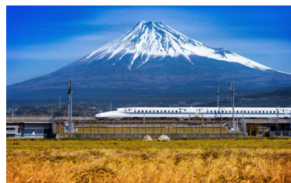
TREN BALA (SHINKANSEN)

Desayuno. Dejaremos el hotel para emprender nuestro viaje hacia Shirakawago, una encantadora aldea montañosa. En la misma región, se encuentra Gokayama, que bordea el valle del río Shogawa en una zona remota de montaña que se extiende entre las prefecturas de Gifu y Toyama. Ambas regiones son famosas por sus pintorescas viviendas gassho-zukuri, muchas de las cuales tienen más de 250 años de antigüedad, declaradas Patrimonio