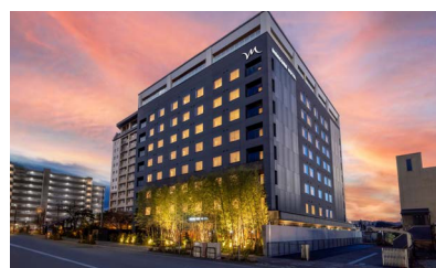
TAKAYAMA: MERCURE HIDA SUPERIOR TWIN