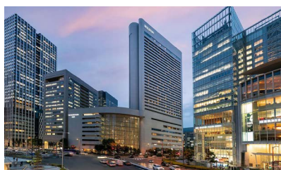
OSAKA: HOTEL HILTON