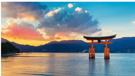
PUERTA TORII FLOTANTE, HIROSHIMA

Desayuno. Salida hacia la estación de Kanazawa donde tomaremos un tren bala hacia Tsuruga. Luego cambiaremos de tren para subirnos al Limited Express con destino a Kioto. Una vez en Kioto, nos subiremos a un tren bala con destino a Hiroshima. El resto de la tarde queda libre junto a nuestro guía.