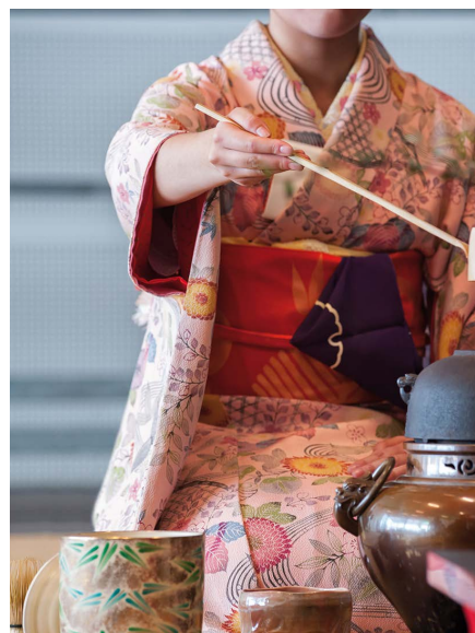
CEREMONIA DEL TÉ

A la hora del té, participaremos en una ceremonia del té tradicional con una Maiko (aprendiz de geisha). La Maiko nos dará la bienvenida y nos enseñará el arte de preparar el té verde. Luego de esta experiencia cultural inolvidable, nos trasladaremos al hotel.