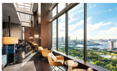
TOKIO: CONRAD TOKYO CITY VIEW