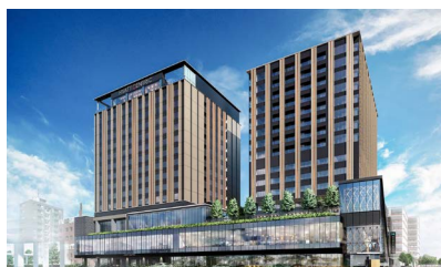
KANAZAWA: HYATT CENTRIC CLASSIC