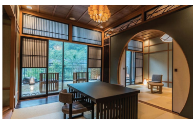
HAKONE: KOWAKIEN TENYU SUPERIOR TWIN WITH OPEN AIR BATH