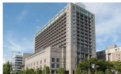
KIOTO: HOTEL OKURA SUPERIOR TWIN