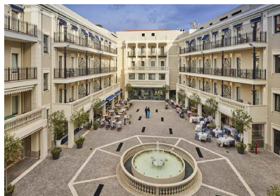
CAGLIARI: PALAZZO DOGLIO