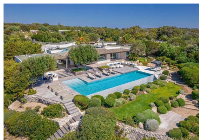
BONIFACIO: HOTEL CALA DI GRECCO