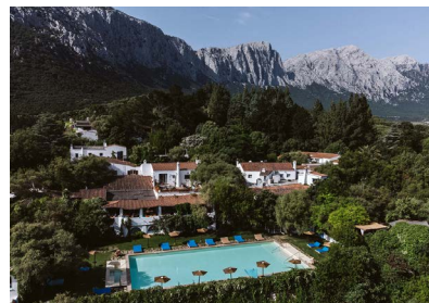
BARBAGIA: SU GOLOGONE