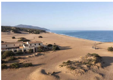
COSTA VERDE: LE DUNE PISCINAS