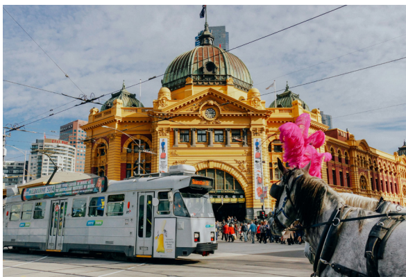
FLINDERS STREET STATION, MELBOURNE

hacia la histórica Flinders Street Station, un ícono arquitectónico de la ciudad.