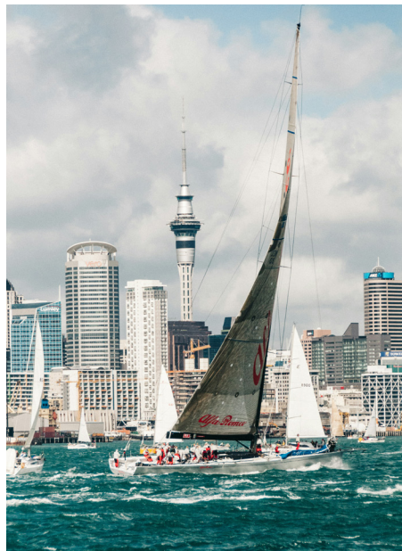
AUCKLAND, LA CIUDAD DE LAS VELAS

Seguiremos el recorrido hacia Mission Bay, un lugar emblemático de la ciudad, y luego visitaremos el encantador barrio de Parnell, uno de los más antiguos de Auckland. Antes de regresar al hotel, haremos una parada en el Museo de Auckland, donde podremos admirar su interesante colección de arte y reliquias maoríes y polinesias.