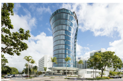
CAIRNS: CRYSTALBROOK RILEY