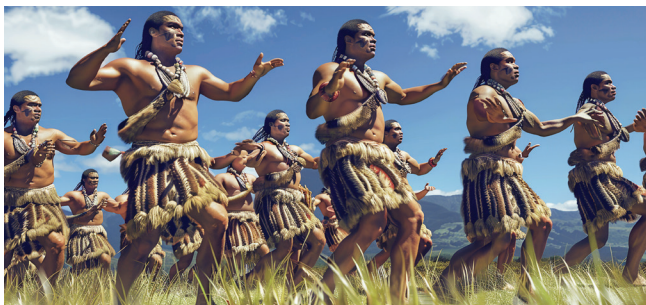
MAORÍES EJECUTANDO SUS DANZAS TÍPICAS

Desayuno. Salida hacia Waitomo para visitar las famosas cuevas de larvas luminosas. Luego de la visita, tendremos un almuerzo en Roselands Resort. El viaje continúa hacia Rotorua, ciudad con un fuerte legado Maorí y que ha sido rebautizada como la “Ciudad del Azufre” por su impresionante actividad geotermal. Llegada y traslado al hotel.