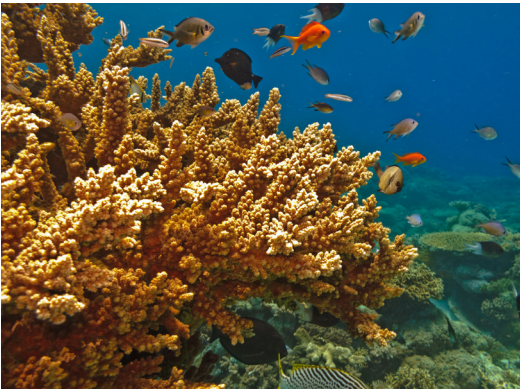
GRAN BARRERA DE CORAL

Desayuno. Traslado al aeropuerto para tomar vuelo con destino a Cairns. Llegada y traslado al hotel, de esta ciudad tropical en el norte de Australia, con clima hermoso durante todo el año.