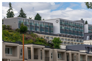
QUEENSTOWN: QT QUEENSTOWN