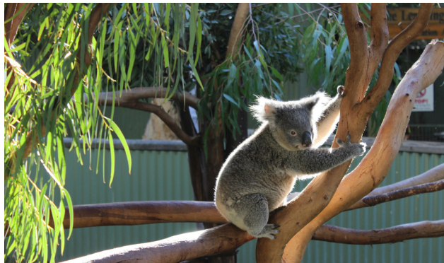
KOALA, ANIMAL AUTÓCTONO DE AUSTRALIA

Desayuno. A la hora oportuna, traslado al aeropuerto para tomar vuelo con destino a Sydney. Llegada, recepción en el aeropuerto y traslado al hotel. Resto de la tarde libre para comenzar a recorrer la ciudad junto a nuestro guía. Sydney es una de las ciudades más visitadas del mundo, moderna, vibrante y rodeada de playas y verdes, conserva la frescura ofreciendo las más sofisticadas tiendas, una vida nocturna muy movida y paisajes increíbles, sin olvidar el más famoso puente en una de las bahías más hermosas que existen.