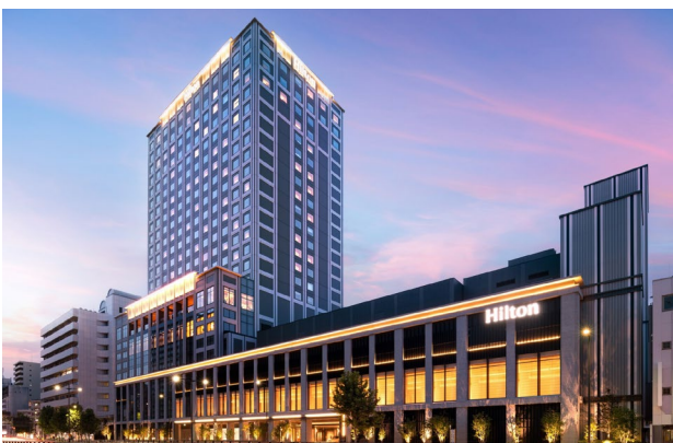
Hiroshima: Hilton Hotel