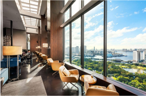
Tokyo: Conrad Hotel