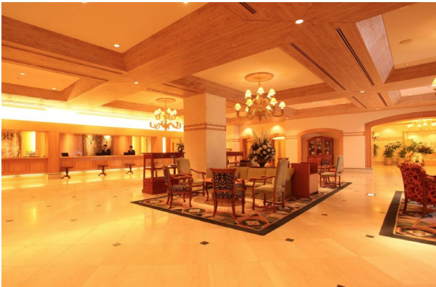
Takayama: Associa Resorts