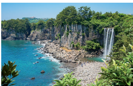
Isla de Jeju