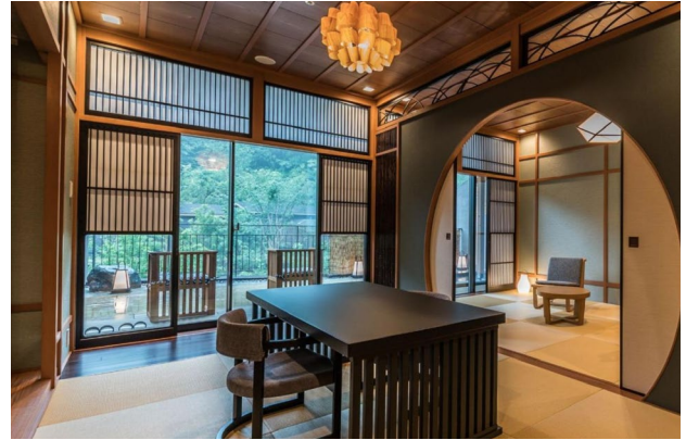
Hakone: Kowakien Tenyu