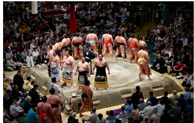
Luchadores de Sumo

Desayuno. Dejaremos atrás Tokio para emprender el viaje hacia Mishima y después Hakone, la puerta de entrada al Monte Fuji. En Mishima visitaremos el Mishima Skywalk, que es el puente colgante peatonal