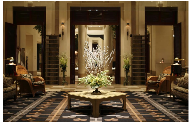
Kanazawa: Hotel Nikko