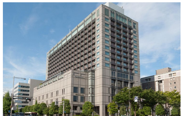
Kyoto: Hotel Okura