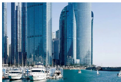
Busán: Hotel Park Hyatt