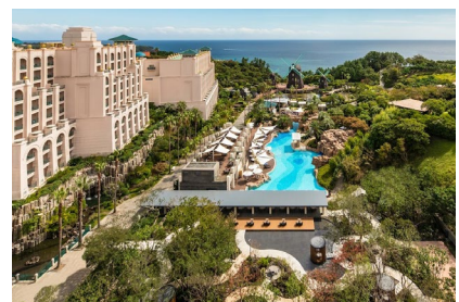
Jeju: Hotel Lotte