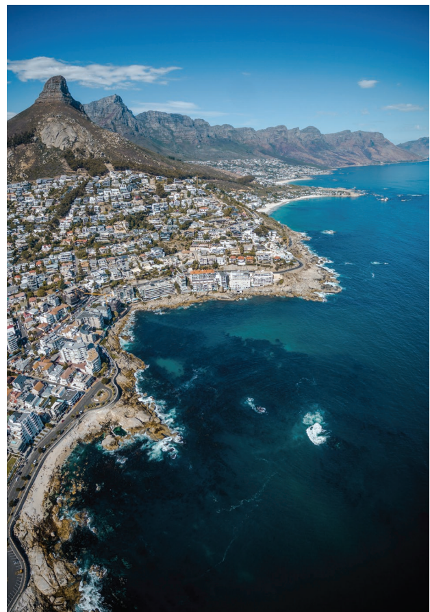
Ciudad del Cabo

Desayuno. A la hora indicada, traslado al aeropuerto, y fin del viaje.