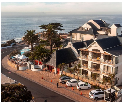
Hermanus: Harbour House