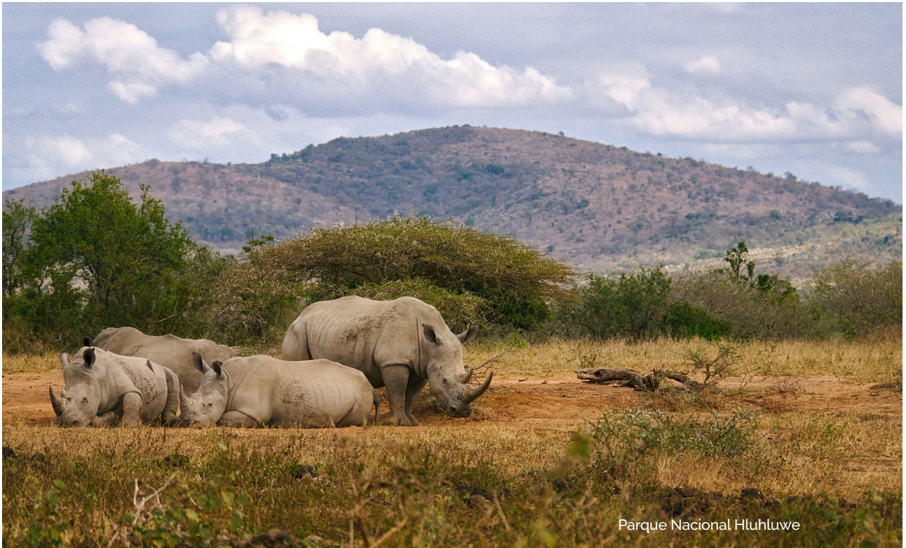
Parque Nacional Hluhluwe

breve pero interesante parada panorámica en la ciudad de Pretoria.