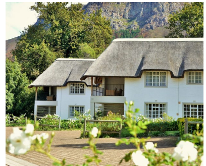
Viñedos del Cabo: Le Franschoek