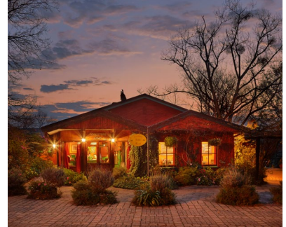
Eswatini: Foresters Arms