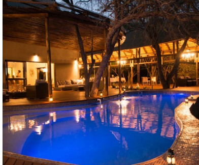
Parque Krüger: Reserva privada de Moditto