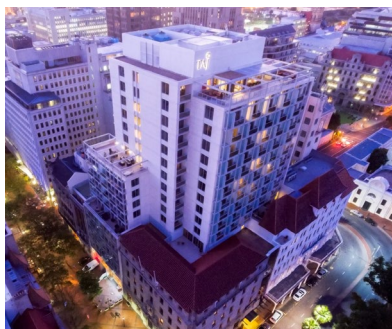
Ciudad del Cabo: Taj Hotel