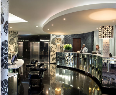
Johannesburgo: Hotel Da Vinci