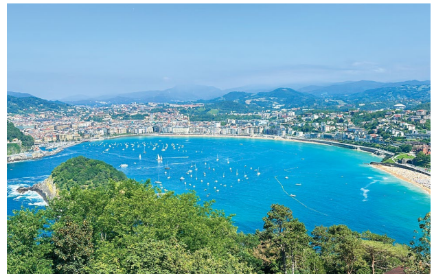
San Sebastián, vista desde el Monte Igeldo

Desayuno. Por la mañana, partiremos hacia Santillana del Mar, una de las localidades más valiosas en cuanto a su patrimonio histórico y artístico en España. Conocida como "la villa de las tres mentiras" porque ni es "santa", ni "llana", ni tiene "mar", esta encantadora villa es un monumento en sí misma. Nuestra visita incluirá un recorrido por el Museo y la Neocueva de Altamira, conocida como la "capilla sixtina" del arte rupestre. Aquí, exploraremos las famosas pinturas prehistóricas que datan de hace 14.000 años y conoceremos la fascinante historia de su descubrimiento por Marcelino Sanz de Sautuola y su hija María en 1879. Después, disfrutaremos de