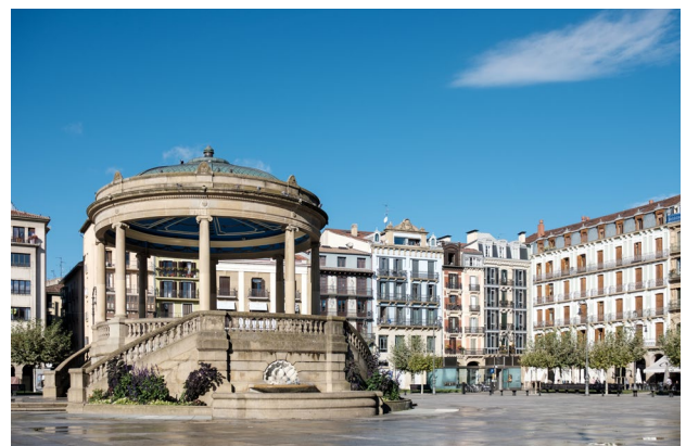
Plaza del Castillo, Pamplona