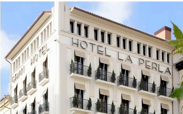
Pamplona: Gran Hotel La Perla