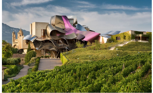
Elciego: Hotel Marqués de Riscal