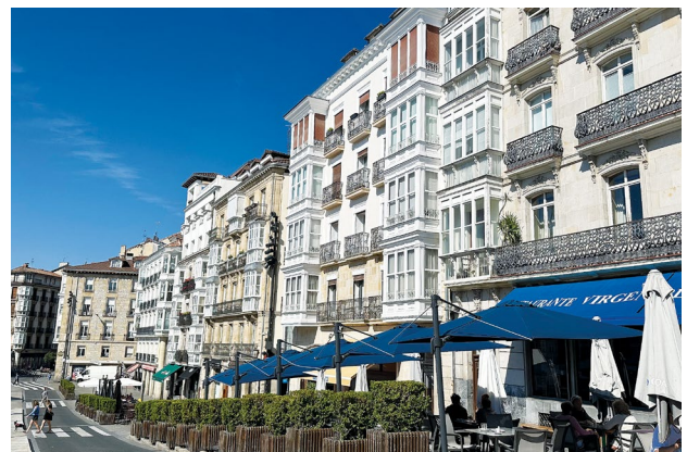
Plaza de la Virgen Blanca, Vitoria

tiempo libre para almorzar en Santillana del Mar, donde podremos sumergirnos en la atmósfera histórica de la villa. Por la tarde, nos trasladaremos a Santander para explorar sus principales atracciones, como la Catedral de Santander, el Palacio de la Magdalena, el Sardinero y el Centro Botín, entre otros. Al finalizar la visita, regresaremos a Bilbao. Alojamiento