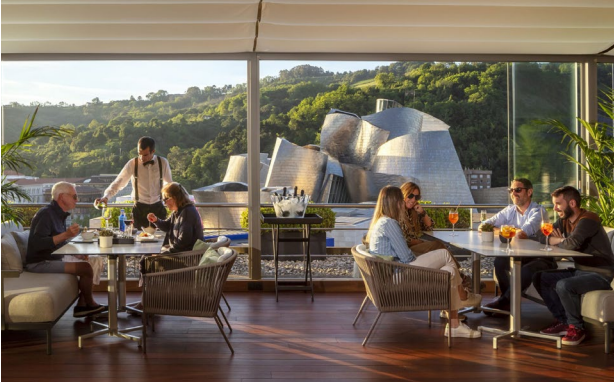
Bilbao: Hotel The Artist