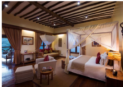
Ngorongoro: Neptune Luxury