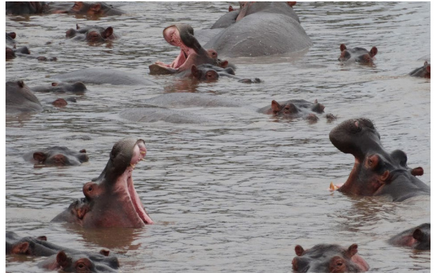
Hipopótamos en su hábitat

Desayuno. Por la mañana salida hacia la frontera con Tanzania, realizamos los trámites de inmigración y seguimos ruta hacia Arusha. Almuerzo en el Arusha