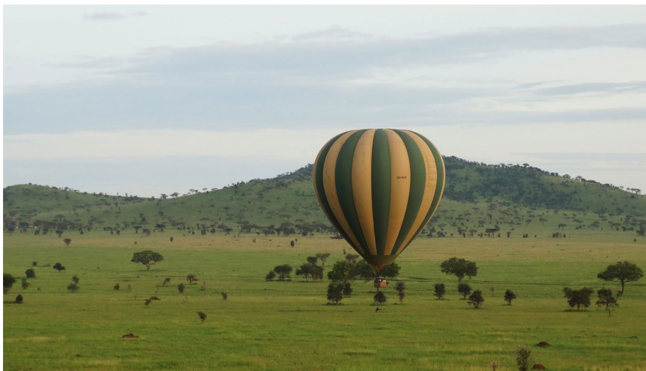
Sobrevuelo en globo aerostático