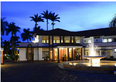
Entebbe: Laico Lake Victoria