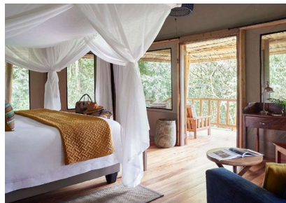
Bwindi: Sanctuary Gorilla Forest Camp Lodge