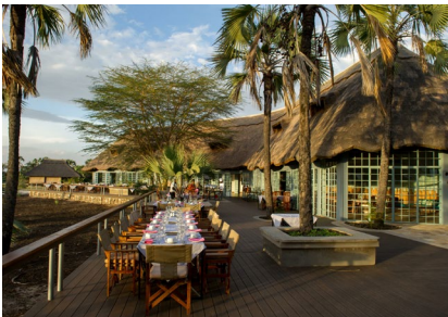
Tarangire: Maramboi Tented Lodge