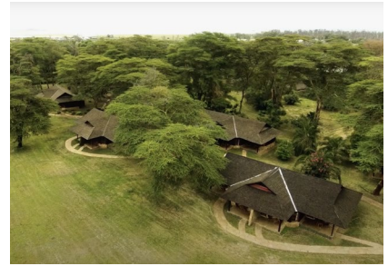
Amboseli: Ol Tukai Lodge