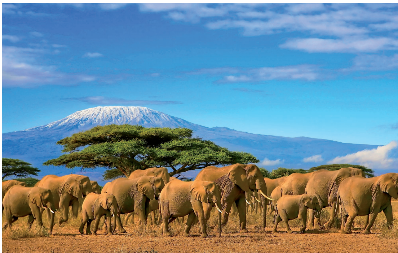
Elefantes con el Monte Kilimanjaro como telón de fondo