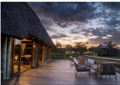
Serengeti Oeste: Mara Mara Tended Lodge