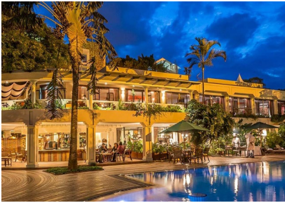
Nairobi: Serena hotel