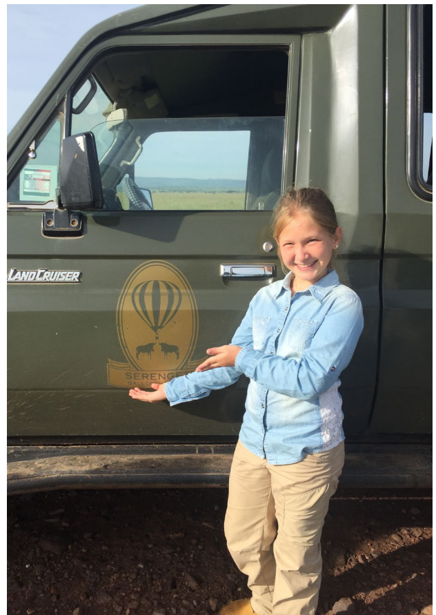
Un destino para toda la familia

Desayuno. Traslado al aeródromo para tomar vuelo hacia Kilimanjaro y fin del viaje.