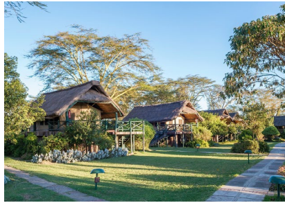
Ol Pejeta: Sweetwaters Serena Camp