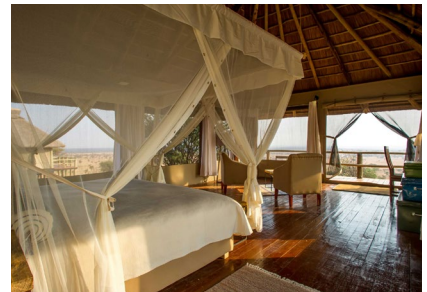
Serengeti Central: Kubukubu Lodge