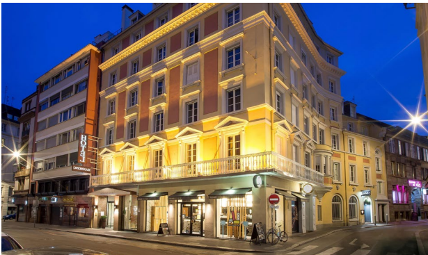
Estrasburgo: Hannong Hotel & Wine Bar