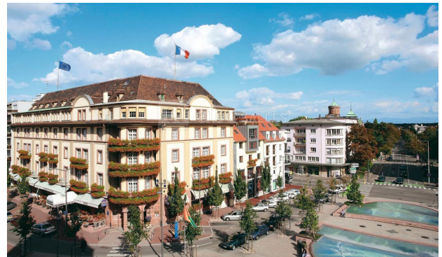
Colmar: Grand Hotel Le Bristol