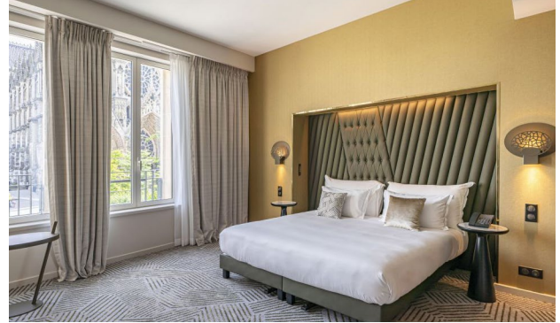
Reims: La Caserne Chanzy Hotel & Spa