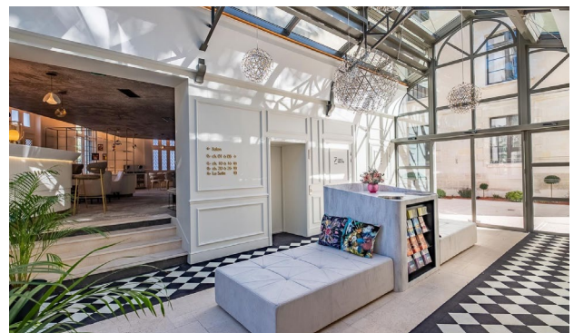
Tours: Hotel Les Tresorières