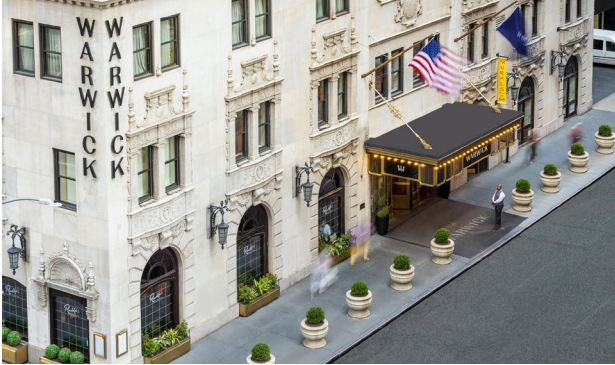
Paris: Hotel Warwick