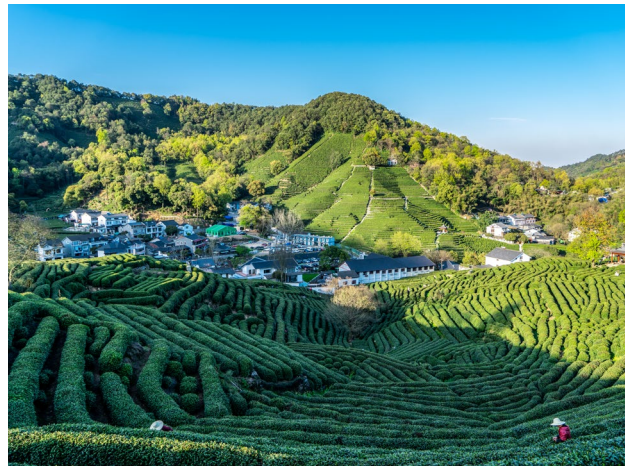
Plantaciones de té en Hangzhou

Desayuno. A la hora indicada, partiremos hacia Xian. Llegada, asistencia y traslado al hotel. Xian era una de las antiguas capitales de China y fue durante las Dinastías Zhou, Qin, Han, Sui y Tang que se utilizó como tal. Hoy día es la capital de la provincia de Shanxi, antiguo centro de la ruta de la seda hacia el occidente y mantiene intacta una gran muralla que rodeaba a la ciudad. La excelente ubicación del hotel Wyndham