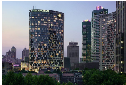
Shanghai: The Langham Xintiandi Hotel