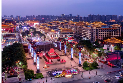
Xian: Wyndham Grand South Hotel