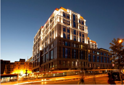
Beijing: Hilton Wangfujing Hotel