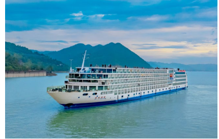
Crucero: Century Cruises Glory