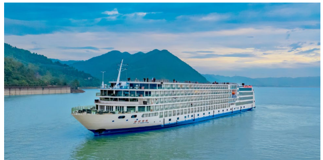
Crucero de lujo por el río Yangtzé

Grand Xian South, nos posiciona frente a la zona de la Dinastía Tang. Tarde-noche libre para pasear y conocer la vida nocturna local.