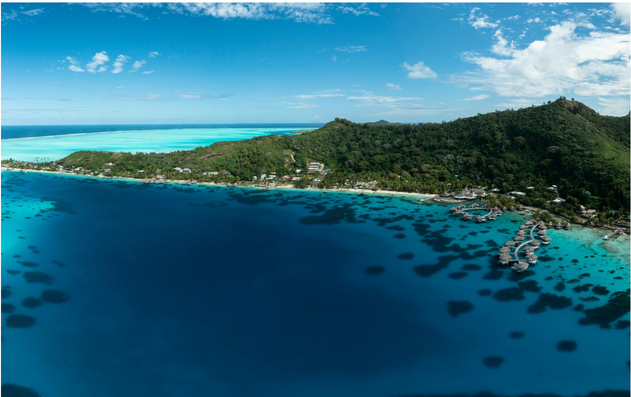
Vista aérea de Bora Bora

una impresionante formación rocosa y haremos una parada en la Playa Avaio.