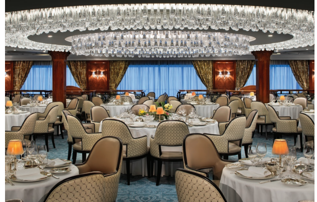
Grand dining room