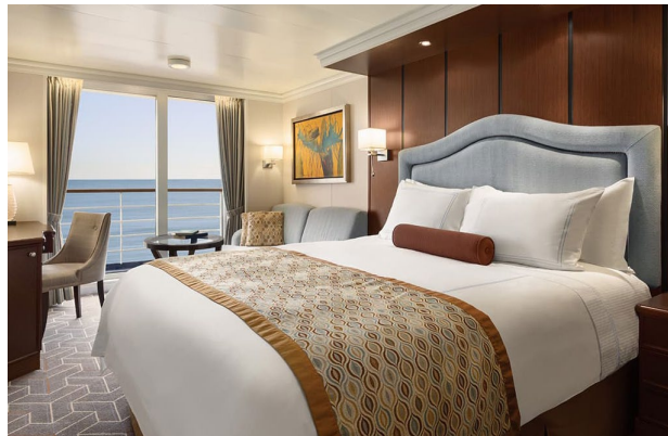
Crucero Marina, Oceanía Cruises