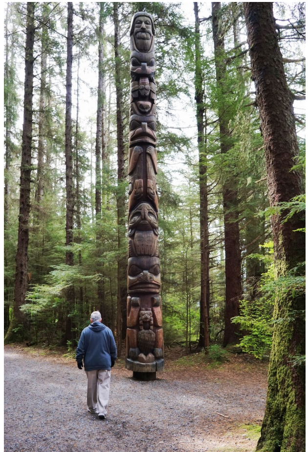
Tótem en Ketchikan

Pensión completa. Durante el día de hoy haremos un recorrido por la primera ciudad de Alaska. Las calles y los