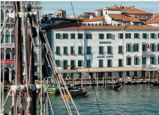
Venecia: Mónaco & Gran Canal