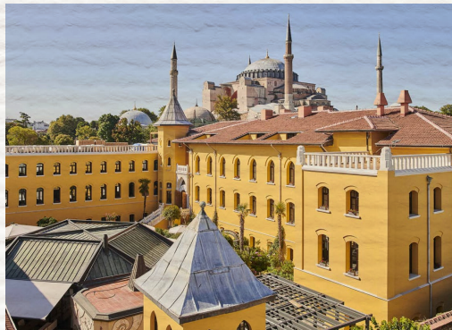
Estambul: Four Seasons