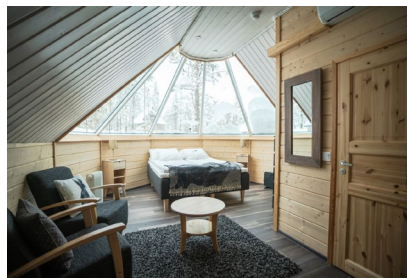
Levi: Northern Lights Village